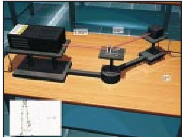
Figura 1. A figura mostra um laboratório virtual onde se pode realizar a experiência sobre o efeito Compton. Tecnologias de multimídia permitem posicionar o detector (caixinha preta à direita) em quatro posições distintas e observar a variação do chamado deslocamento Compton através de gráficos.

É também finalidade do projeto Remav integrar serviços de laboratórios de física na cidade do Rio de Janeiro. Um exemplo disso ocorre entre o laboratório de nanoscopia da