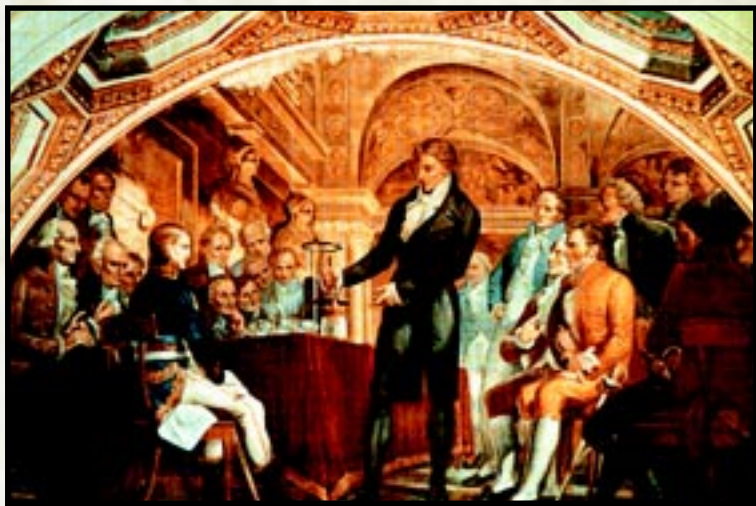
Figura 3. Volta exhibe seus aparelhos elétricos para Napoleão, em pintura de autor desconhecido

no mundo inteiro, que abrangia também as possíveis aplicações práticas. Assim, Volta foi convidado em 1801 por Napoleão Bonaparte, então cônsul da França, para que apresentasse os efeitos elétricos de sua pilha (figura 3). Foi nessa oportunidade, no Instituto Nacional da França, que o físico italiano recebeu uma medalha de ouro de Napoleão, escrevendo em seguida para seus familiares: "À vida acomodada de uma glória vã