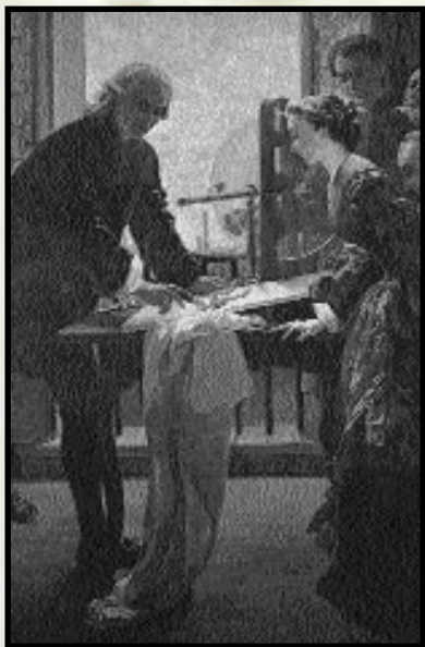
Figura 1. Galvani mostrando a seus discípulos o efeito da eletricidade sobre os músculos de uma mãe, em pintura de autor desconhecido

Em meados do século 18, já existiam máquinas elétricas, baseadas na geração de eletricidade por atrito, que eram as grandes atrações nas academias, onde físicos profissionais e amadores realizavam experiências. O físico holandês Pieter van Musschenbroek (1692-1761), da Universidade de Leyden, desenvolveu um aparelho em 1746 que ficaria conhecido como garrafa de Leyden. Ele usou uma garrafa de vidro com água, tampada com uma rolha atravessada por um